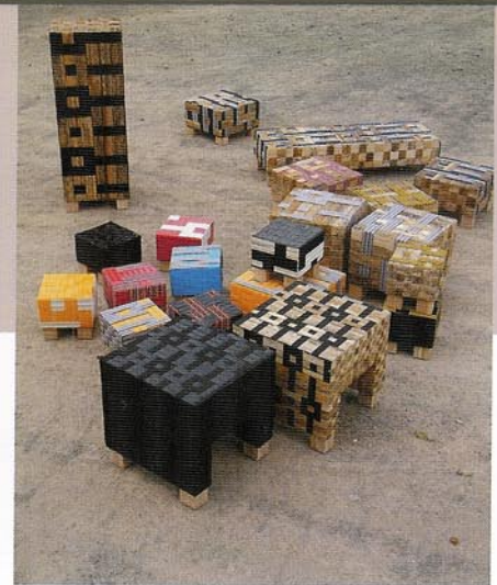
Weaving Vietnam-project voor Haans BV. Diverse producten van bananenbladeren, waterhyacint, hout en elastiek.

zelf moet uitzoeken", zegt ze over die jaren. "Je krijgt verschillende producten aangeboden, maar je moet zelf uitvissen wat de kwaliteiten en mogelijkheden zijn. De lessen worden ook gegeven door mensen uit het vak: kunstenaars en vormgevers. Door deze aanpak leer je al snel zelfstandig werken en beslissen. Ik ben er op een onorthodoxe manier met keramiek begonnen en ben me gaan richten op bestaande en alledaagse, herkenbare producten. Lampen van elektriciteitsdraad (Draad Lamp, 2002), een keramische Ritskan (2002), geïnspireerd op het werk van Borek Sipek, een Halve Kan (2002), een keramische kan met twee verschillende helften en het gestapelde kopje My cup of tea (2002), waarin twee, drie of vier barokke kopjes gestapeld worden tot een nieuwe vorm. Dit laatste ontwerp is momenteel in productie bij het bedrijf Haans in Tilburg."