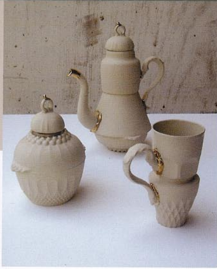
Ctrl C / Ctrl V Keramiek, 2005; steengoed; theekan h 23 cm, b 18 cm; beker h 13 cm, b 12 cm; suikerpot, h 15 cm, b 14 cm.